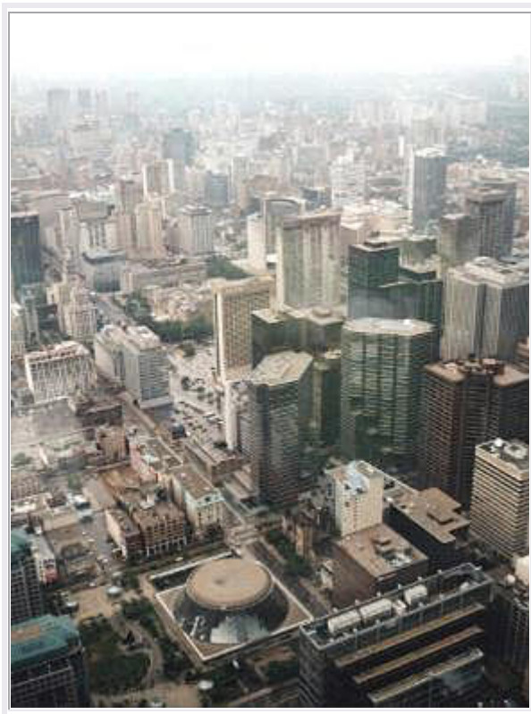
Blick vom CN Tower und Skydome

Wir unterbrechen unseren Rundgang für einen Lunch in der Cafeteria, und gegen 16:30 Uhr verlassen wir das Museum und fahren zum CN Tower , dem höchsten Turm der Welt (553m). Die Gewitter haben sich verzogen, aber die Wolken hängen noch tief über der Stadt. So lohnt es sich leider nicht auf den 'Sky Pod' in 447m Höhe zu fahren, von dem aus man bei guter Sicht bis zu den Niagarafällen sehen kann.