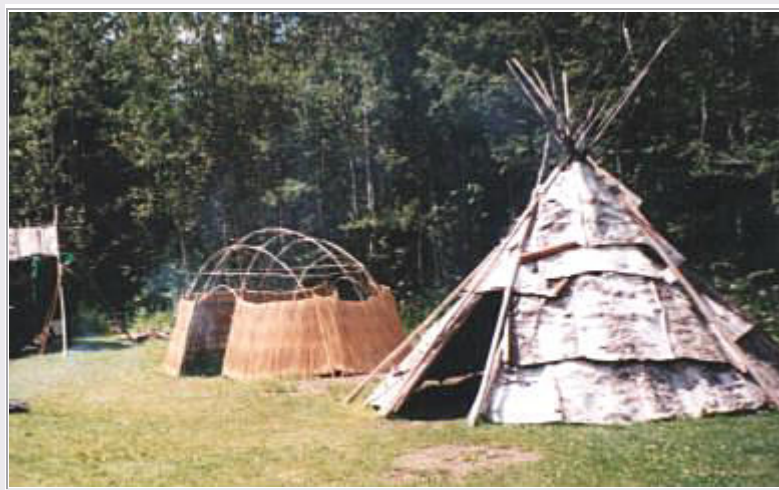
Beim Grand Portage NM: Teepee (Indianerzelt) aus Birkenrinde

Nach kurzer Fahrt sind wir beim Grand Portage NM , ein großes Blockhaus mit Nebengebäuden auf einer Wiese direkt am See. Hier war zu Zeiten der Pelzhändler die Kanu-Fahrt von Osten her über die Großen Seen erst mal zu Ende und die Kanus mussten über Land zu den nächsten Gewässern weiter westlich geschleppt werden. Wir besichtigen die Bauten mit ihren Inneneinrichtungen, schauen uns den Film über die Geschichte an und bummeln über das Gelände. Eine Indianerin demonstriert, wie Körbe aus Birkenrinde gemacht werden und auch die Teepees, die auf den Prärien mit Büffelhaut gebaut werden, werden hier mit Birkenrinde gemacht. Das Material ist in den riesigen Birkenwäldern dieser Gegend reichlich vorhanden. In einem Nebengebäude bekommen wir gezeigt, wie ein großes Kanu ebenfalls aus Birkenrinde entsteht. Abgedichtet wird es mit einer Mischung aus Harz und Honig.