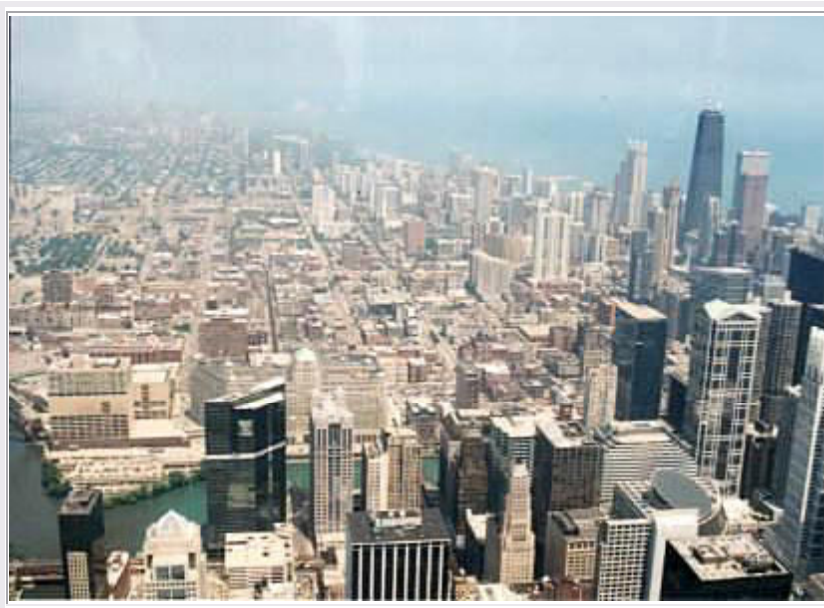
Chicago: Blick vom Sears Tower (links unten: Chicago River mit 'unserem' Hotel, rechts oben: John Hancock Center, Lake Michigan)

Gegen 11 Uhr machen wir uns auf, um die Stadt zu besichtigen. Unser Hotel liegt so günstig, dass wir alles zu Fuß erreichen können. Allerdings herrscht zur Zeit hier eine Hitzewelle. Wir wandern bei ca. 35 Grad durch das geschäftige Treiben auf der Franklin Street. Unsere erste Station ist der Sears Tower , das höchste Hochhaus der Welt (485m, 110 Stockwerke). Zunächst sehen wir uns den Film an, dann bringt uns der Fahrstuhl mit 32km/h zum 'Skydeck'. Dort hat man aus 450m Höhe einen atemberaubenden Blick auf die Stadt, den Lake Michigan und bei guter Sicht, die wir wegen der Hitze nicht haben, 80km ins Land. Allerdings kann man nur durch Glasscheiben blicken, was für die Fotos nicht optimal ist.