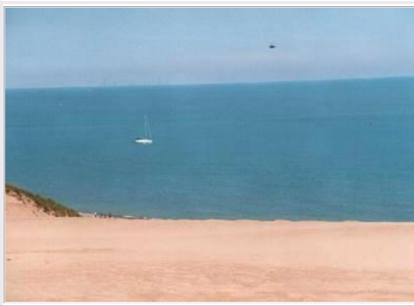
Indiana Dunes NL am Lake Michigan (am Horizont die Skyline von Chicago)

Um 10:10 Uhr fahren wir bei unserem Hotel in Kalamazoo direkt auf die Interstate 94 Richtung Westen. An der Südspitze des Lake Michigan, praktisch an unserem Weg, liegt die Indiana Dunes NL , aber es ist nicht so einfach, die richtige Straße von der Autobahn zu treffen. Wir halten beim Indiana Visitor Center, um uns eine Karte zu besorgen, fahren dann irgendwo ab und treffen nach einiger Suche auf den Hwy 12, der zum Park führt. Dieser besteht aus vielen kleinen Gebieten an der Küste und im Binnenland, die die Industrie noch für die Natur freigelassen hat. Am äußersten Westen befindet sich der Mt. Baldy , eine hohe, kaum bewachsene Wanderdüne aus weißem Sand. Wir wandern zunächst durch ein Wäldchen und klettern dann den riesigen Sandberg hinauf. Von oben hat man einen tollen Blick! Im Süden ragt der Sand steil aus dem Waldgebiet heraus, im Nordwesten die unendliche Weite des Lake Michigan, wo man im Dunst am Horizont die Skyline von Chicago erspähen kann (Bild).