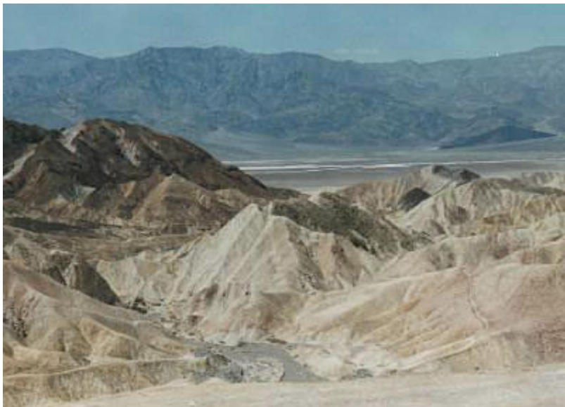
Der berühmte Zabriskie Point

Dann fahren wir zurück und wenden uns Richtung Süden. Im Visitor Center sehen wir u.a. eine Dia-Show an. Es schließt sich ein Abstecher an, vorbei an ' Furnace Creek ', zum ' Zabriskie Point ' mit den bunten Lehmhügeln, die wie Felsen aussehen.