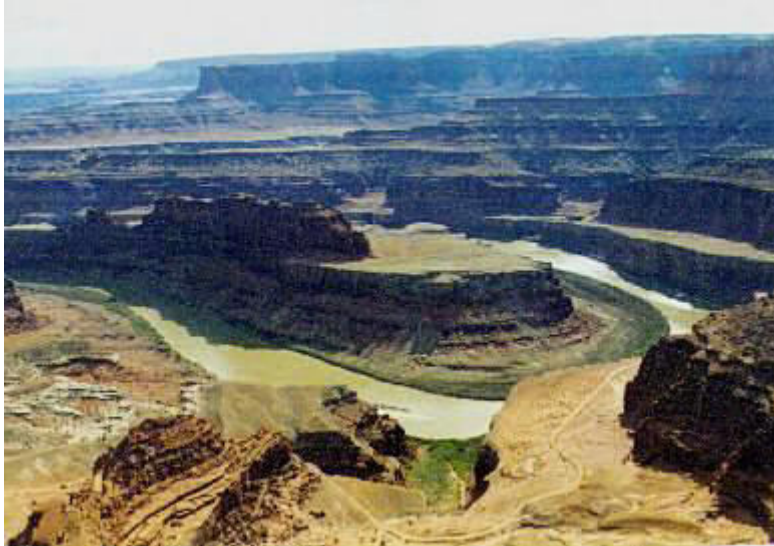
Dead Horse Point