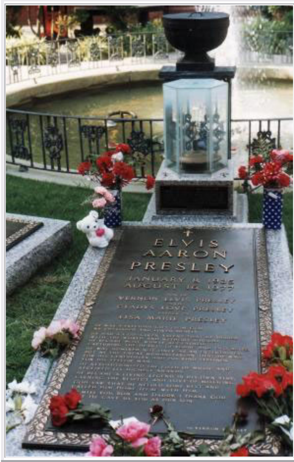
Memphis: Das Grab von Elvis Presley

Zum Schluss wandern wir durch den schön angelegten Garten , in dessen einer Ecke die drei Gräber von Elvis und seinen Eltern zu besichtigen sind.