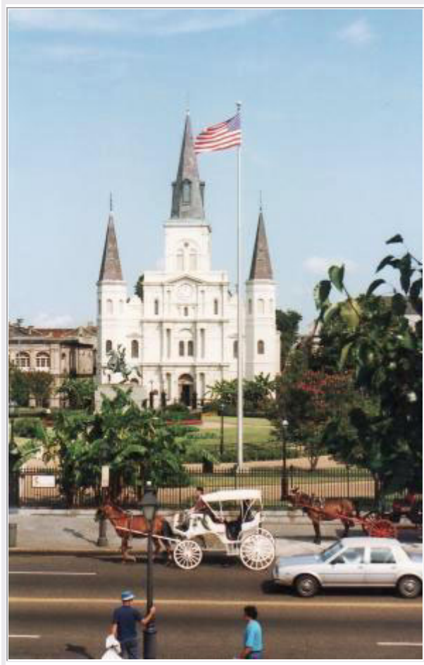
New Orleans: Der 'Jackson Square'

Nach dem Ausladen bei unserem Hotel im French Quarter machen wir noch einen kurzen Rundgang durch die Umgebung, über den ' Jackson Square ', wo an jeder Ecke ein Künstler seine Musik zum Besten gibt, bis zum Mississippi-Ufer, wo die Ausflugsdampfer liegen. Im Hotel essen wir dann zu Abend, sehen fern und planen die nächsten Tage.