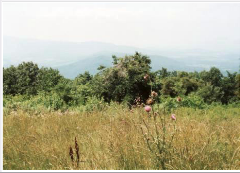
Im Shenandoah National Park

Heute verabschieden wir uns von unseren amerikanischen Gastgebern in Manassas und starten zu unserer Rundfahrt. Zunächst suchen wir einen Supermarkt auf, um uns mit Reiseproviant zu versorgen. Um 10:30 Uhr geht's dann los. Wir fahren auf der Interstate 65 nach Westen und biegen dann nach Süden ab, wo bald den Shenandoah National Park erreichen. Wir besuchen erst mal das Visitor Center, um uns über den Park zu informieren.