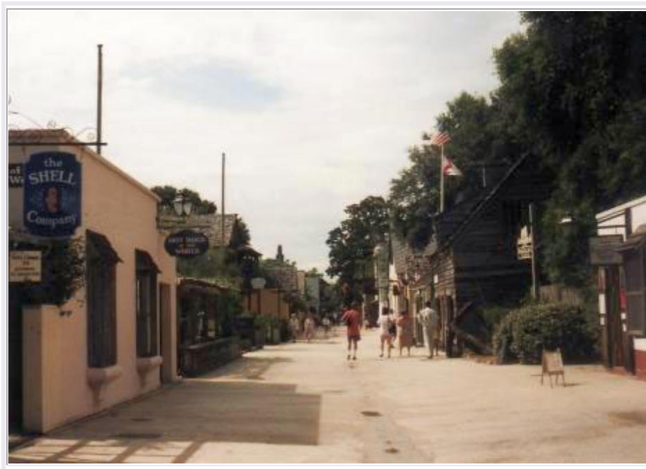
St.Augustine: Im 'Spanish Quarter'

Um 10:30 Uhr fahren wir in die Innenstadt. Vom Parkplatz, wo wir erst noch eine alte Mühle besichtigen, geht's mit dem 'Sightseeing Train' in die Altstadt, dem sog. 'Spanish Quarter' . St.Augustine ist die älteste Stadt der USA , gegründet von den Spaniern im Jahre 1565 , 55 Jahre bevor die englischen Pilgrims mit der 'Mayflower' in Nordamerika ankamen. Das Spanish Quarter ist ein 'Living History Museum' , wo das Leben der Menschen hier um 1740 demonstriert wird. Leute in entsprechender Tracht führen Handarbeiten vor, kochen Mahlzeiten und zeigen ihr Handwerk der damalige Zeit. Die Häuser dieses Viertels sind entsprechend restauriert und eingerichtet. Wir bummeln durch die Fußgängerzone und schauen uns die Vorführungen an, werfen einen Blick in die zahlreichen Läden