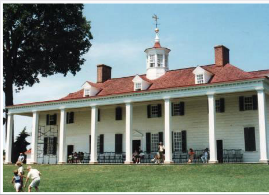
'Mount Vernon': Das Haus von George Washington am Potomac River

Um 10:30 Uhr starten wir unsere heutige Tour nach Mount Vernon. Das war der Wohnsitz von George Washington , dem 1. Präsidenten der USA. Das Anwesen liegt auf einer Anhöhe oberhalb des breiten Potomac River . Wir nehmen an einer Führung durch das große Haus teil, das vollständig mit größtenteils originalen Möbeln und anderen Gegenständen eingerichtet ist. An der Flussseite befindet sich eine große Veranda (Bild), wo wir uns auf einer Bank ausruhen, während die Kinder auf der großen Wiese davor herumtollen.