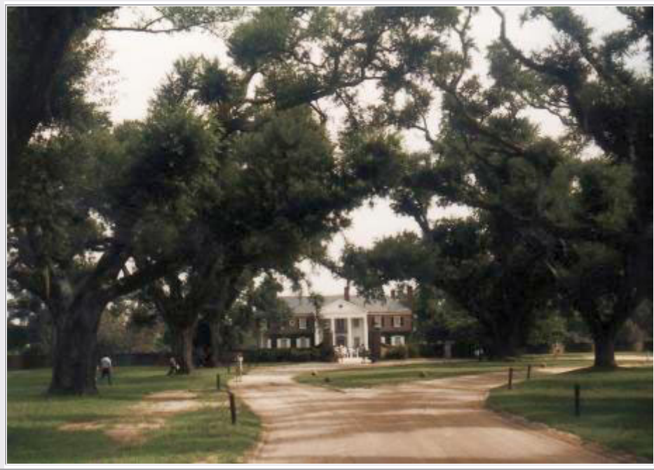
'Boon Hall Plantation' bei Charleston

25.Tag: Charleston - Boon Hall Plantation - Myrtle Beach , Strand