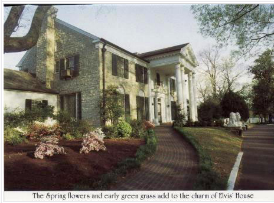
Memphis: Die Villa von Elvis (Postkarte)

Um 9:30 Uhr starten wir in Huntsville zur Weiterfahrt auf der R72 nach Westen und erreichen gegen 14 Uhr unser Motel in Memphis . Wir packen aus und stärken uns etwas mit unserem Reiseproviant.