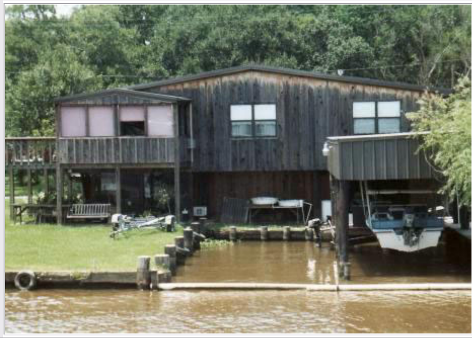
New Orleans: Mit einem Raddampfer fahren wir durch die Bayous

Um 10 Uhr verlassen wir das Hotel und bummeln durch die Stadt. Wir kommen zum 'French Market' , dem Marktviertel und erreichen schließlich nach Überqueren der Straßenbahnschienen das Ufer des Mississippi, den sog. 'River Walk' . Hier starten die Boote und Raddampfer zu unterschiedlichen Touren auf den verschiedenen Gewässern. Wir legen um 11 Uhr mit einem Raddampfer unter lautem Getöse ab und haben dabei einen schönen Blick auf die Stadt mit dem 'Jackson Square'