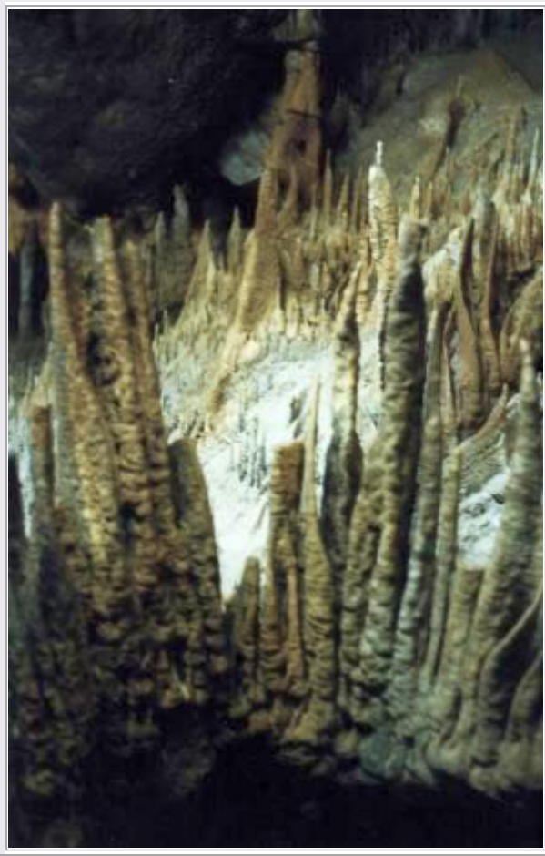
In der 'Mammoth Cave', Kentucky

Um 9:25 Uhr starten wir in Charleston, bewegen uns auf der I64 Richtung Westen und erreichen bald Kentucky , die Heimat der Pferdezüchter. Es ist ein leicht welliges grünes Grasland und überall sieht man die Ranches mit den Pferdekoppeln, die mit weißgestrichenen Zäunen umgeben sind. Wir passieren Lexington und fahren den ' Bluegrass Parkway ' nach Südwesten. Nach einer ziemlich langen Fahrt, die wir durch eine Picknickpause unterbrochen haben, erreichen wir den Parkplatz bei der berühmten