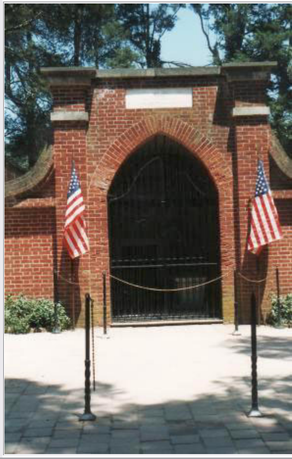
'Mount Vernon': Das Grabmal von George Washington

Wir wandern über das Gelände, sehen uns die Ställe und Schuppen mit Pferdefuhrwerken etc. an und werfen einen Blick in die Sklavenunterkünfte. Dann geht's durch den parkähnlichen Garten zum Grabmal von George Washington. Nachdem wir etwas gegessen und getrunken haben und alles gesehen haben, brechen wir wieder auf.