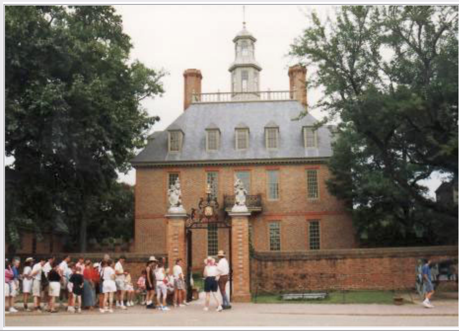
Colonial Williamsburg: der Governor's Palace

Um 10 Uhr verlassen wir unser Motel und fahren nach Colonial Williamsburg , einem bewohnten historischen Freilichtmuseum. Hierher verlegte 1699 der britische Gouverneur der britischen Kolonie Virginia seine Residenz. Vorher war sein Sitz in der ersten britischen Siedlung Nordamerikas (1607), dem nahe gelegenen Jamestown . Dort wie hier in Williamsburg werden die historischen Gebäude sowie das Leben der Menschen und ihre Häuser zur Kolonialzeit dargestellt.