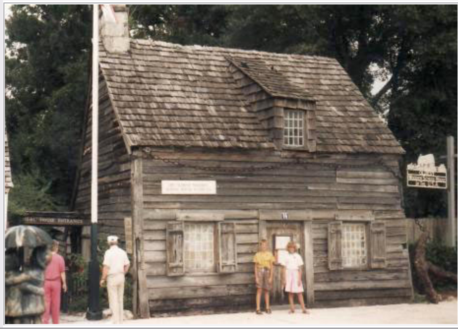
St. Augustine: Das älteste hölzerne Schulhaus der USA

Wir besichtigen das ' Oldest Wooden Schoolhouse '. Es ist ein kleines Blockhaus (Bild: hinten rechts!) mit Schulbänken darin, auf denen Schülerpuppen sitzen. Der Lehrer steht an der Tafel und seine Stimme kommt vom Band. Hinter dem Gebäude befindet sich ein kleiner Garten.