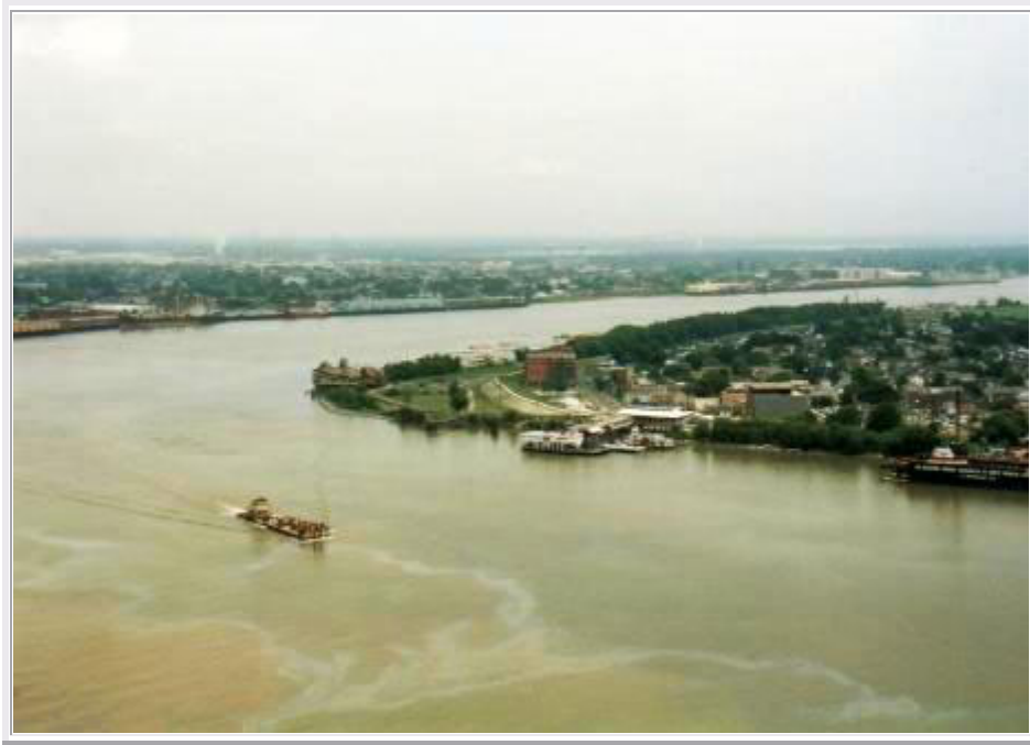
New Orleans: Blick vom 'Top of the Mart' auf den Mississippi

Wir wenden uns wieder in Richtung des Flusses. Dort gibt es eins der wenigen Hochhäuser, das 'Top of the Mart'. Wir fahren mit dem Fahrstuhl außen an der Wand bis zum 31. Stockwerk. Von dort hat man einen atemberaubenden Blick über die Stadt, den Mississippi und die ganze Umgebung. Wieder unten angekommen, wandern wir den River Walk entlang, ein großer Brunnen bringt Abkühlung, und landen dann im ebenfalls besuchenswerten Cafe du Monde , wo wir Cafe au Lait trinken (eine Tasse nehmen wir als Souvenir mit!) und Beignets essen. Dann besuchen wir noch eine Shopping Mall und kehren zum Hotel zurück, um das Auto zu holen.