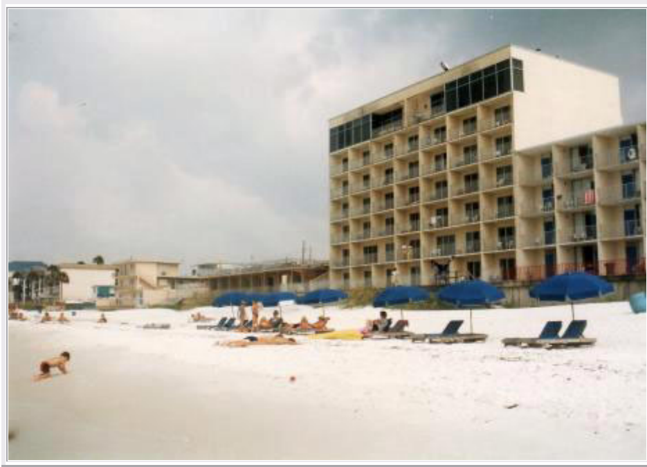
Panama City Beach: Luftaufnahme (Postkarte) Panama City Beach: Sonnenbaden vor dem Hotel

Heute strahlt die Sonne von wolkenlosem Himmel und wir mieten uns um 11 Uhr eine Liege mit Sonnenschirm. Das Meer ist ruhig und kristallklar. Wir gehen mehrmals im Meer schwimmen und ruhen uns dann im Schatten des Sonnenschirms aus. Trotz Sonnencreme und Schatten können wir leichte Hautrötungen nicht vermeiden. Die Kinder sind mit dem weißen Sand und dem warmen Wasser in ihrem Element. Mittags wird wieder eine Melone vertilgt.