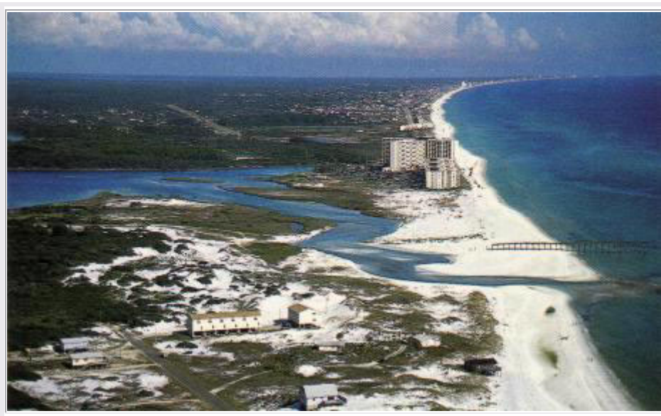
Panama City Beach: Luftaufnahme (Postkarte)

Morgens machen wir einen Spaziergang am Strand entlang. Wir beobachten die Pelikane, die auf dem Meer schwimmen und die im Sturzflug ins Wasser tauchen, um sich einen Fisch zu fangen ( siehe Bild von 1995 )