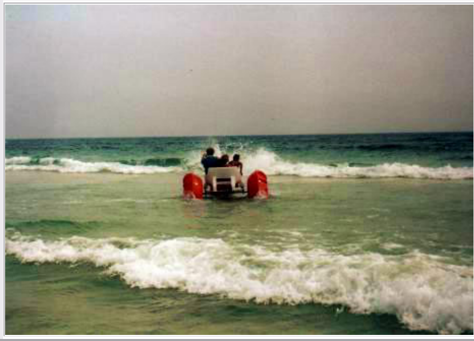
Panama City Beach: Fahrt mit dem schwimmenden Dreirad

Heute ist es wieder sonnig und heiß, und es läuft das gleiche Programm ab wie gestern: Dösen und Lesen auf der Liege am Strand, Schwimmen im Meer und im Pool, und die Kinder spielen in Sand und Wasser. Nachmittags essen wir Kuchen und Donuts.