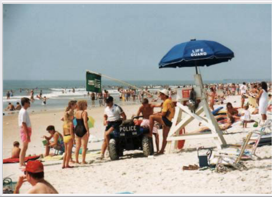
Myrtle Beach: Sicherer Strand mit Life Guard und Polizei

Nachdem wir alles gesehen haben, fahren wir um 11:30 Uhr weiter auf der Route 17 und kommen 2 Stunden später in Myrtle Beach an, dem beliebten Strandurlaubsort am Atlantik. Wir beziehen unser Hotel. Vom Fenster aus können wir zwischen 2 Häuserblocks den Ozean schon sehen. Wir fahren zunächst zum Supermarkt zum Einkaufen und machen es uns dann im Hotelzimmer bei Tee und Kuchen gemütlich.