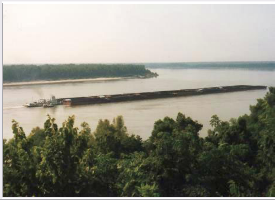
Vicksburg, MS: Lastkahn auf den Mississippi River

Im Visitor Center informieren wir uns über die Stadt und die vielen alten Villen. Dann machen wir eine Rundfahrt durch den Ort und besichtigen einige der 'Plantation Homes' oder Antebellum Homes (Vor-Bürgerkriegs-Häuser). Man wird durch prächtig eingerichtete Räume geführt und über die Lebensgeschichte der früheren Bewohner informiert.