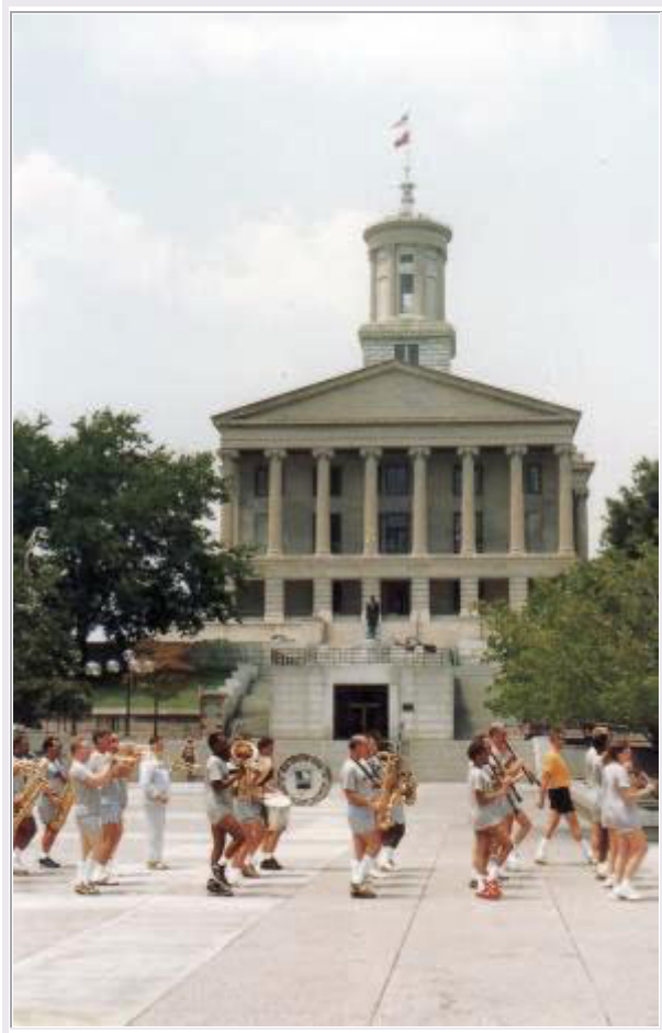
Nashville, TN: Marschmusik vor dem Capitol

Um 9:30 Uhr machen wir uns in Bowling Green auf den Weg. Nach einer Stunde Fahrt sind wir schon bei unserem Hotel 'Days Inn' in Nashville . Wir können zum Glück schon einchecken, und nach kurzer Pause fahren wir in die Downtown . Wir bummeln durch die Straßen, kommen am Capitol vorbei, vor dem gerade eine Militärkapelle die Marschmusik einübt, und besichtigen dann das Tennessee State Museum .