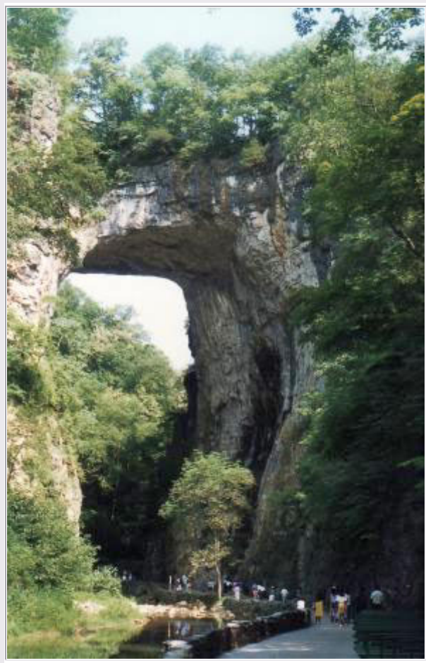
Die 'Natural Bridge' in Virginia

Um 9:25 Uhr brechen wir in Staunton auf und setzen unsere Fahrt auf der I65 nach Süden fort, um alsbald die Natural Bridge erreichen.