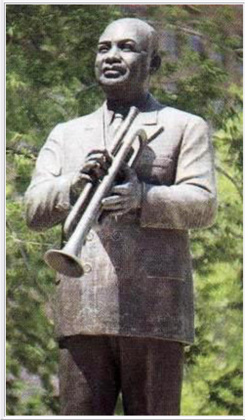
Memphis: Das Denkmal von W.C. Handy