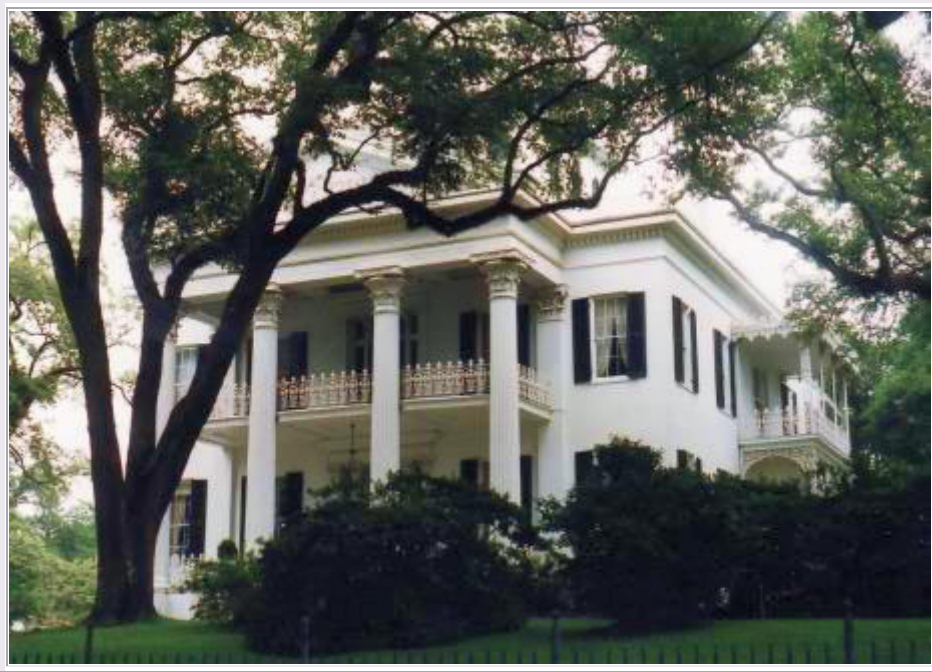
Natchez, MS: 'Stanton Hall' eine der vielen Antebellum-Villen dieser Gegend

Wir starten um 9:30 Uhr vom Hotel in Vicksburg und setzen unsere Reise auf der R61 nach Süden fort. Dann nehmen wir den 'Natchez Trace Parkway' und erreichen gegen 12:00 Uhr Natchez . Auch hier besuchen wir zunächst das Visitor Center und machen dann eine Rundfahrt durch den Ort mit Stops bei sehenswerten 'Antebellum Homes' , wie z.B. der Stanton Hall (Bild).