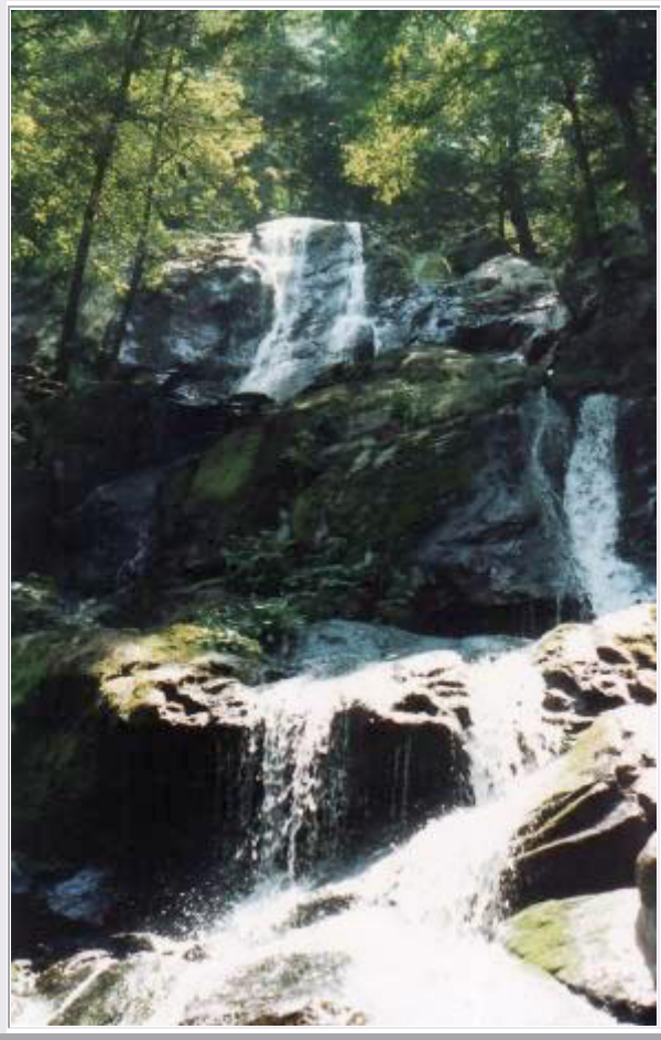
Wanderung zu einem Wasserfall

Der Park ist bei weitem nicht so überlaufen, wie die bekannten Parks im Westen. Es gibt viele Trails , die zum Wandern einladen. Einen solchen Weg steigen wir hinab durch den Wald an einem Bach entlang zu einem Wasserfall. Nach kurzer Pause kraxeln wir wieder hinauf zum Parkplatz. Später machen wir noch Halt an einem der zahlreichen Picknickplätze und verzehren unseren mitgebrachten Kuchen.