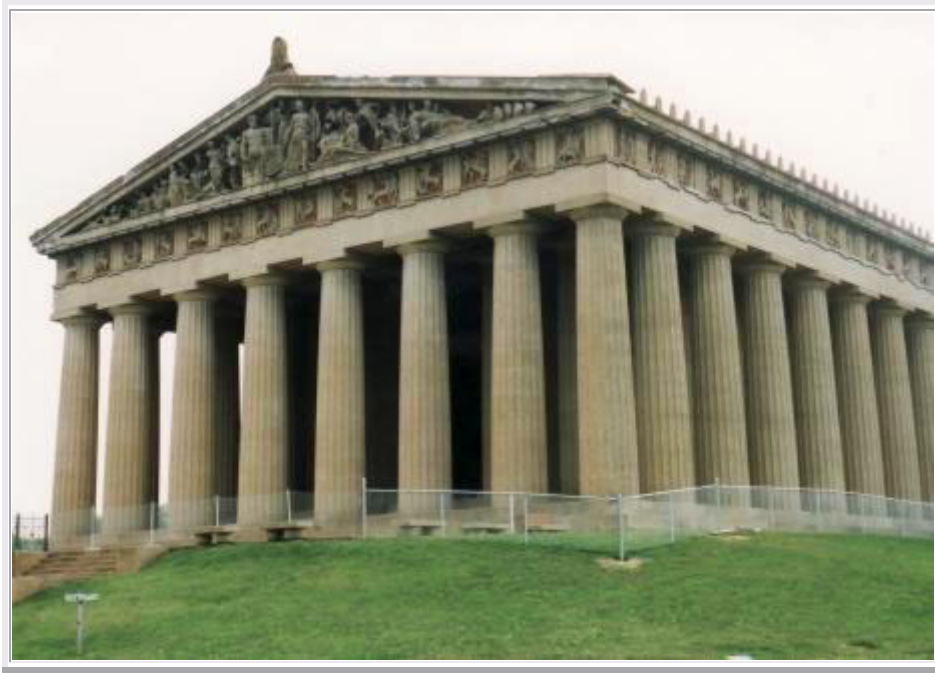
Nashville, TN: Das Parthenon

Nach diesem Erlebnis wandern wir weiter durch die Stadt, bis wir wieder beim Auto sind. Wir fahren noch zu dem Centennial Park , in dem der Parthenon-Tempel aus Athen in Originalgröße nachgebaut ist. Es ist ein merkwürdiger Eindruck, da das Gebäude unversehrt ist und nicht so zerfallen wie das Original.